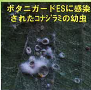
ポタニガードESに感染されたコナジラミの幼虫