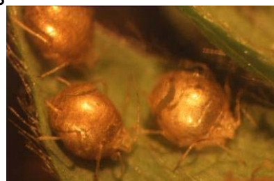
マミーになったアブラムシ